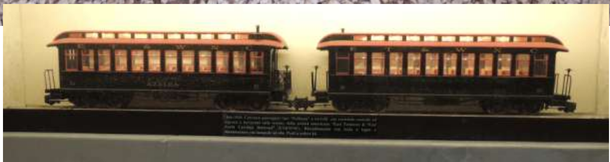
Due vagoni passeggeri per "Mullins" a scartamento ridotto di spazio e progetto 1910-1911 della società "Sud Ferrovia & Tram Sud" (Società Anonima Sudaferrovia), funzionavano tra Suda e Suda Marechiaro (attuale Suda Marechiaro).