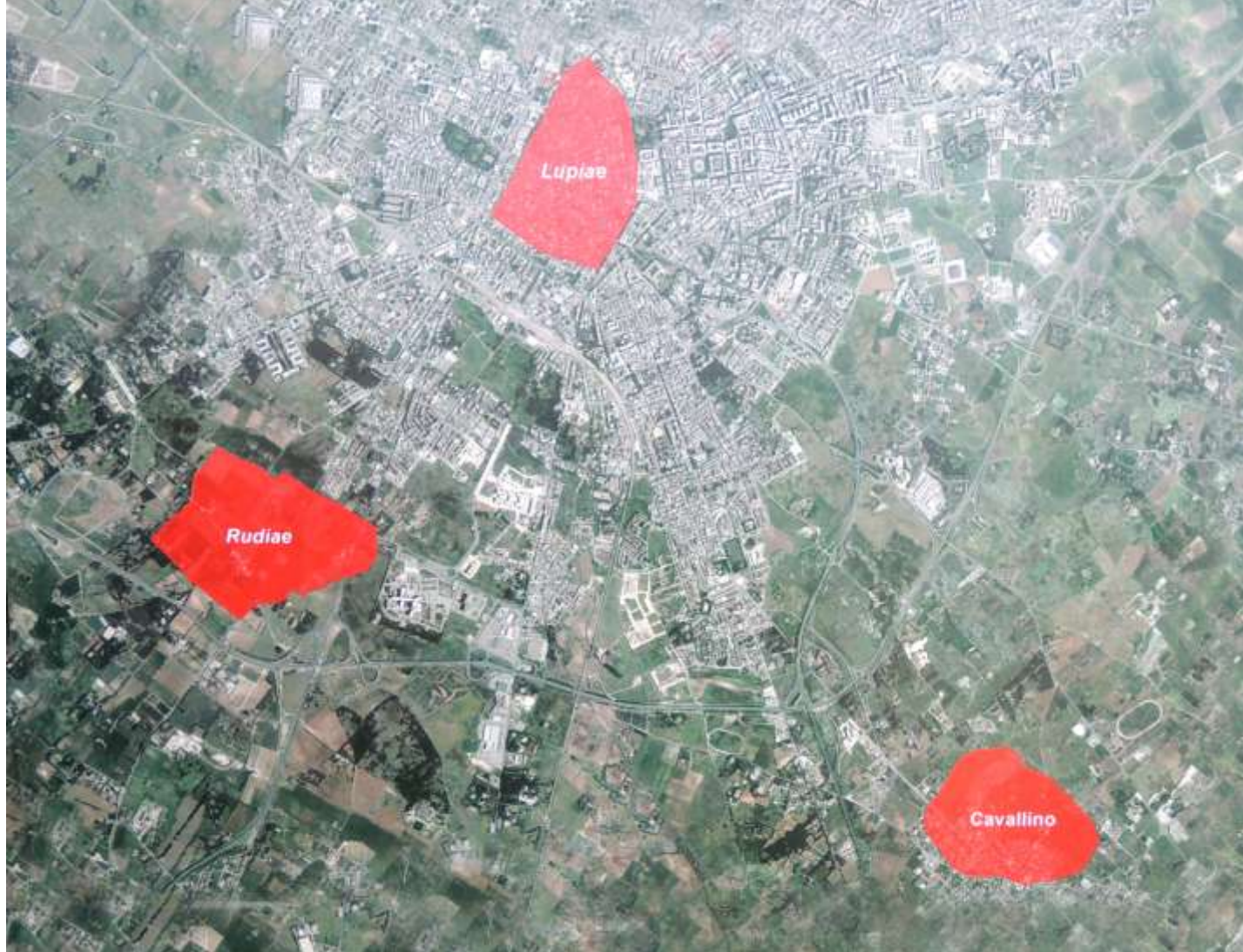
In alto : insediamenti messapici (cartina realizzata dal Dip.to di Beni Culturali dell'Università del Salento) e, in basso , ricostruzione dell'anfiteatro e dell'invaso d'acqua effettuata da A.R.Va srl (spin-off dell'Università del Salento).